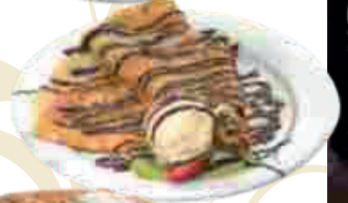
CRÊPE ALLA NUTELLA