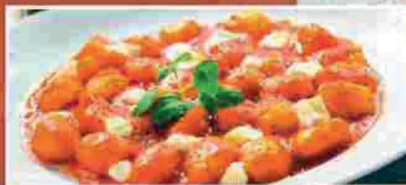
GNOCCHETTI ALLA SORRENTINA