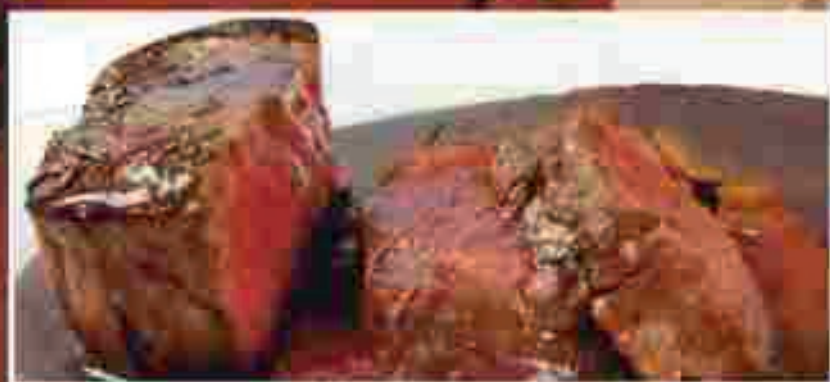
FILETTO DI MANZO