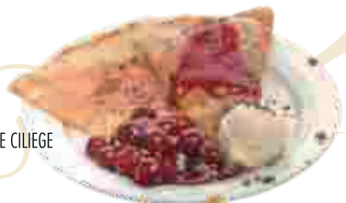
CRÊPE ALLE CILIEGIE