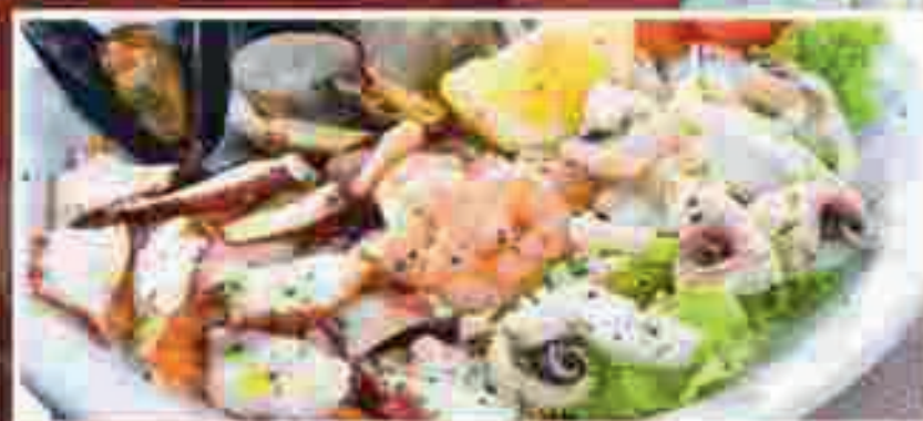
INSALATA DI MARE