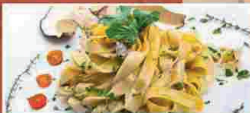
TAGLIATELLE FUNGHI PORCINI