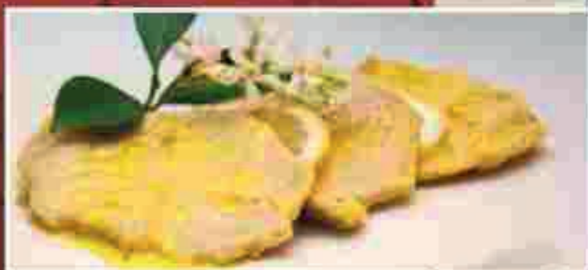
SCALOPPINA AL LIMONE