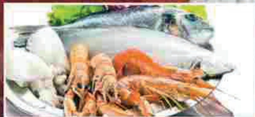
PESCE ALLA GRIGLIA